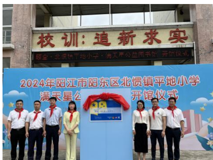
北惯镇平地小学 开馆仪式