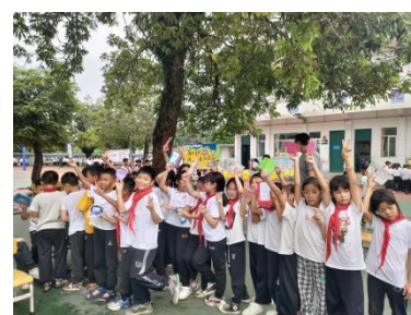
东成镇中心小学 世界读书日