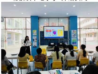
石城镇中心小学 教师认知课