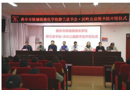
陵城镇德化学校 开馆仪式