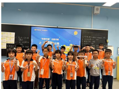
龙尾镇龙珠中心小学 主题书展