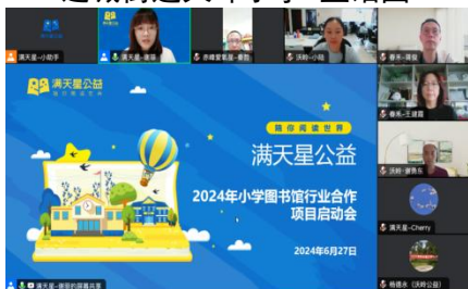
行业合作项目启动会