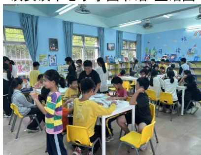
历洞镇沙木小学 阅读课