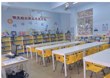
东城镇那味小学图书馆 空馆图