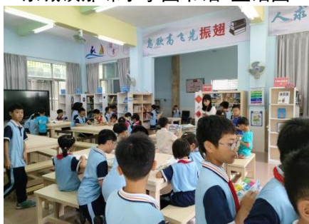
郁南县四一八小学 试运营