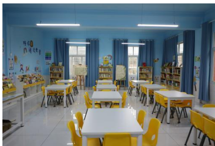
莲城街道天坪小学 空馆图

同时，为赋能合作伙伴图书馆建设与指导能力，开展图书馆培训——“星图系列课程”4 节、配套线上一对一指导，助力伙伴与学校共建图书馆，未来落地到更多地区。