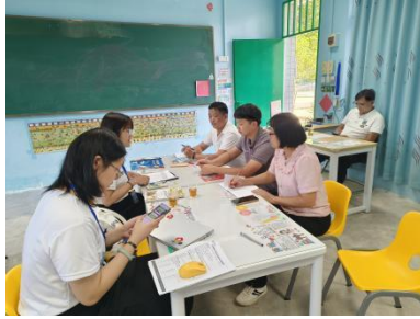
历洞镇内翰小学 实地回访