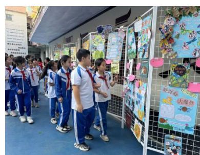
新城镇中心小学北 新书推荐