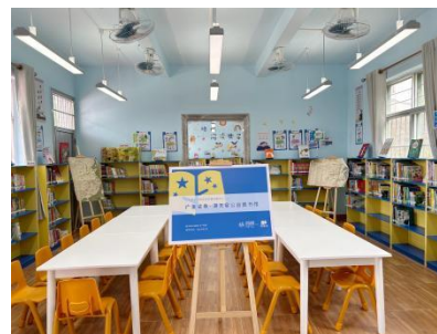
镇安镇中心小学图书馆 空馆图