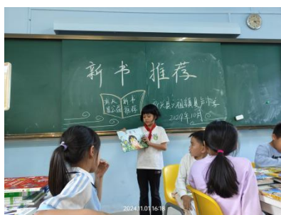
六祖镇夏卢小学 新书见面会