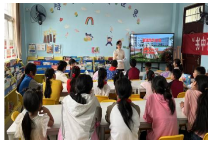
潘塘街中心小学 学生管理员换届