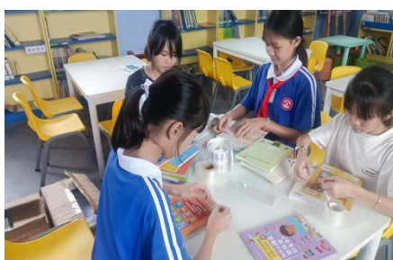
茶阳镇太宁小学 图书加工