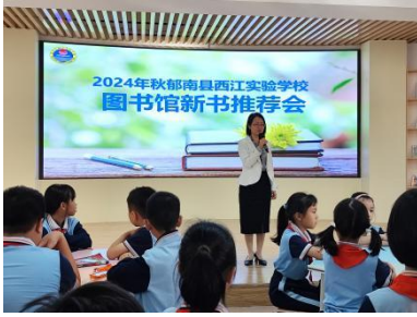
西江实验学校 新书推荐会