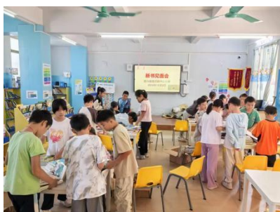
里洞镇中心小学 新书见面会