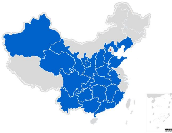
2025 年童书乐捐计划受益项目点覆盖图