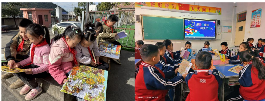
学生阅读所捐赠的图书

通过组织线上教师阅读培训、每周推送绘本视频及阅读活动方案，为项目点老师提供阅读实用技巧及免费阅读资源；同时，通过建立并严格落实图书上架监测机制，确保所有捐赠图书在 7 天内上架并免费开放给孩子阅读，有效保障了图书管理的规范性与使用率，促使孩子的阅读兴趣和阅读习惯初步得到激发。