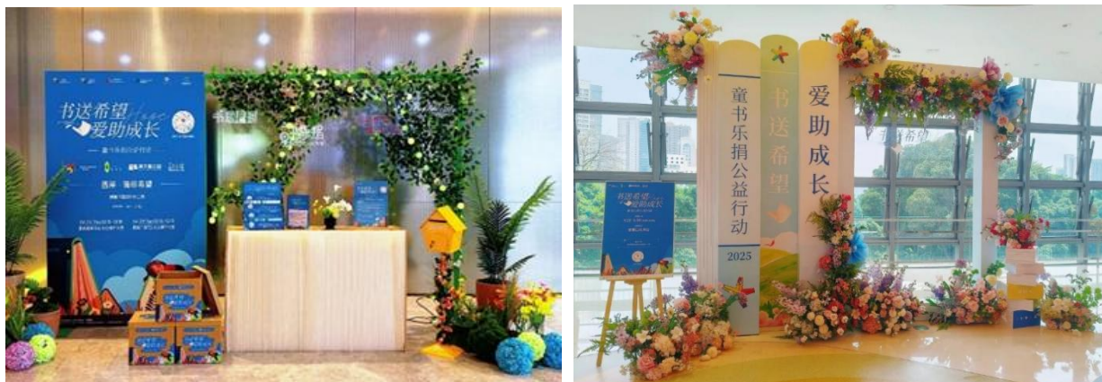
企业团队开展线下募书活动