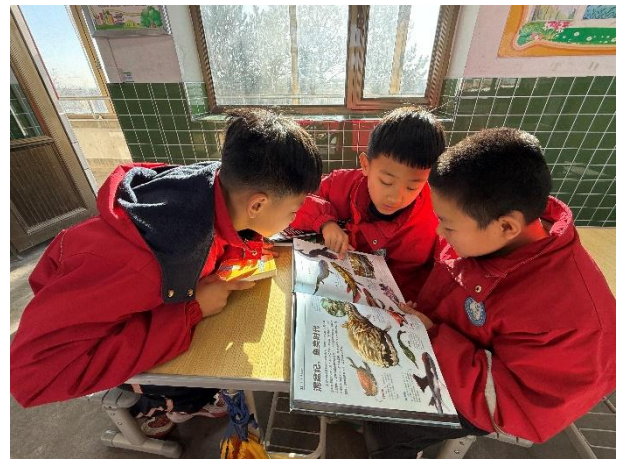
右图-学生课余时间自主阅读