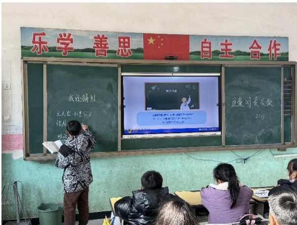
左图-班级开展“我是预言家”阅读活动

项目组将首先构建标准化的协作流程，提升机构内部及外部的的项目相关方的信息同步效率；其次，优化项目进展的可视化监测机制，便于实时掌握项目各环节执行进度；最后，完善从执行到反馈的信息闭环，支持项目数据的系统性收集与分析。项目期待通过推动运营及协作流程的数字化升级，实现更高效及可持续的项目规模化发展。