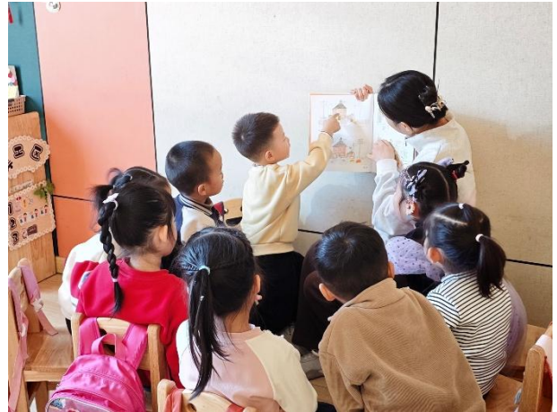
右图-教师为幼儿朗读绘本故事