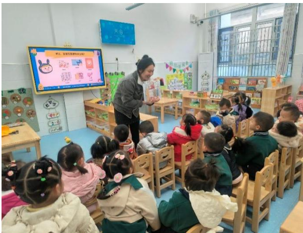
左图-幼儿观看星囊认知课视频

项目还设置了不同年级的阅读推动策略，小学阶段鼓励学生通过图书交换提升阅读量，而幼儿园阶段则着力推动教师持续开展故事朗读活动，帮助学龄前儿童在聆听中积累阅读经验。为此，项目研发了幼儿园星囊认知课，并配套制作 6 个绘本故事会示范视频，通过示范视频支持各地幼儿园教师了解绘本讲述方法与阅读引导技巧，从而推动教师在日常教学中持续开展朗读活动，持续培养学龄前儿童的阅读习惯与兴趣。