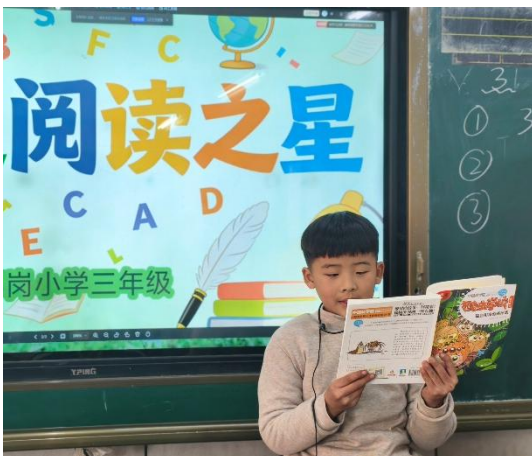
左图-学生进行阅读分享

同时，为确保项目内容贴合乡村幼儿园实际需求，项目组对 14 个合作区县的幼儿园教师及相关合作机构开展了专项调研，针对性研发了“幼儿园星囊阅读包+幼儿园认知课+故事会视频”全套阅读方案，回应教师与学龄前儿童的实际需求，实现了项目从小学向幼儿园的顺利延伸。