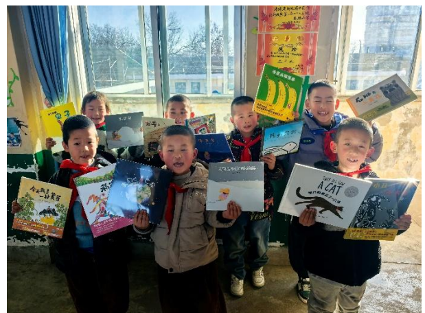
右图-学生兴奋地展示图书