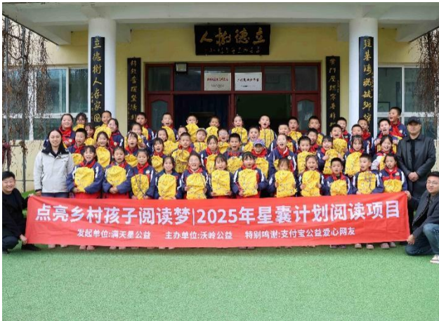
左图-合作机构开展星囊派发活动