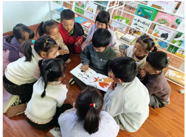
右图-学生共同阅读星囊图书