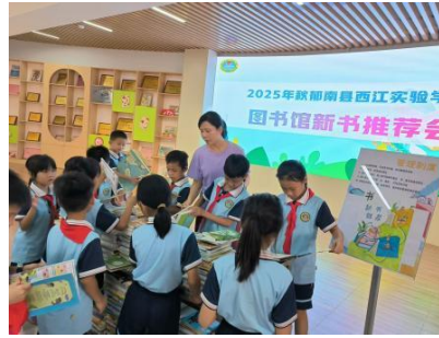
郁南县西江实验学校 新书推荐会