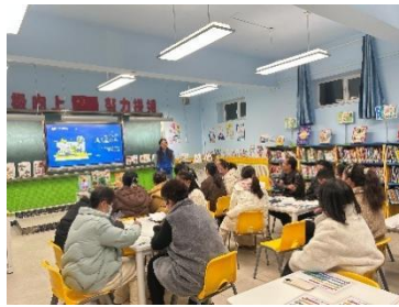
行业合作开馆 童书认知培训