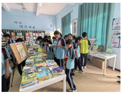
北惯镇平地小学 新书展览