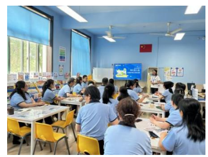
黄楼街道东坝小学 教师认知课