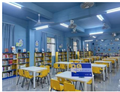
梅陇镇实验学校 空馆图