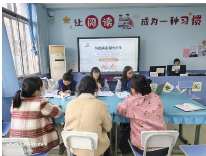
益都街道车站小学 实地回访