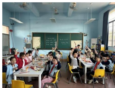
宝珠镇中心学校 学生管理员团建