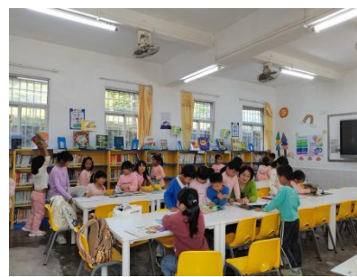
江屯镇联和中心小学 馆内阅读