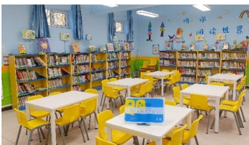
瓜州县双塔镇中心小学 空馆图

2025 年行业合作赋能课程。为赋能在地合作伙伴图书馆建设与指导能力，开展图书馆培训——项目组迭代小学馆合作“星图”系列课程共 5 节，同时配套线上一对一指导，助力伙伴与学校共建图书馆。共三家伙伴机构、1 个工作队参与了学习，逐步掌握从场地布局、图书处理、借阅系统利用、运营管理方法及监测等关键知识，具备基本的图书馆建设与运营指导能力。目前项目试运营情况良好。