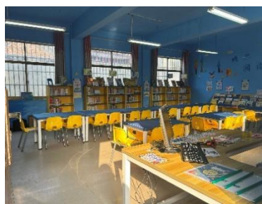
孟寨乡孙营小学 空馆图