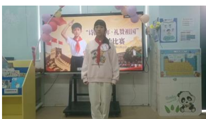
东城镇那味小学 朗诵比赛