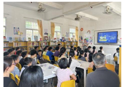
江屯镇联和中心小学 学生认知课

2025 年行业合作赋能课程。为赋能在地合作伙伴图书馆建设与指导能力，开展图书馆培训——项目组迭代小学馆合作“星图”系列课程共 5 节，同时配套线上一对一指导，助力伙伴与学校共建图书馆。共三家伙伴机构、1 个工作队参与了学习，逐步掌握从场地布局、图书处理、借阅系统利用、运营管理方法及监测等关键知识，具备基本的图书馆建设与运营指导能力。目前项目试运营情况良好。