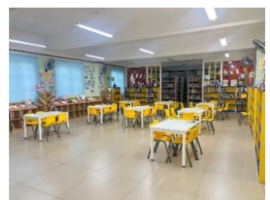
天桥区周闫小学 空馆图