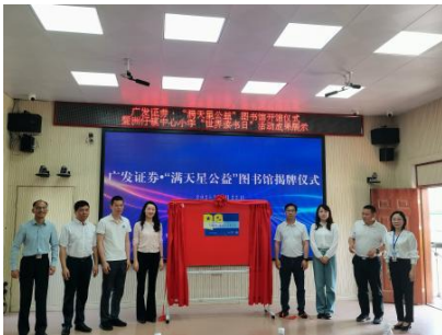
洲仔镇中心小学 开馆仪式