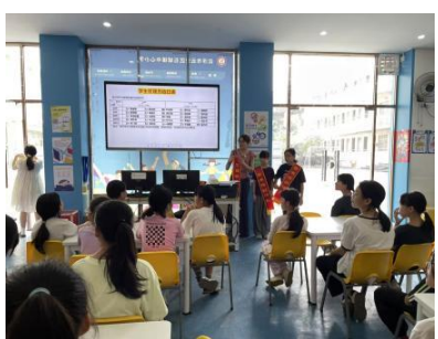
石城镇中心小学 选拔副馆长