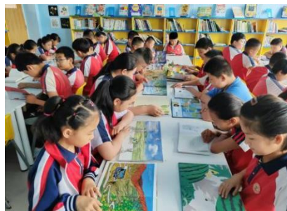
弥河镇大关营小学 阅读课