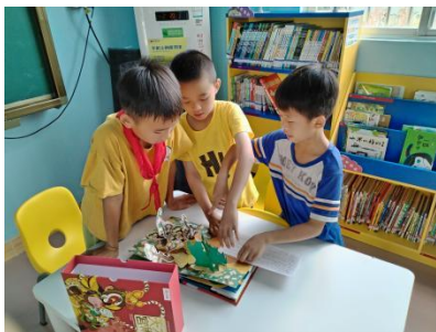
宝珠镇中心小学 学生阅读