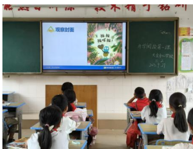
千官镇大全中心学校 阅读课