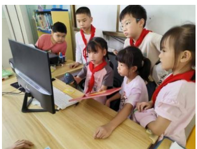
徐古街中心小学 系统培训